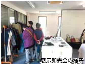
展示即売会の様子

A. 捨てればごみになってしまう布が、作り手のアイデア次第でステキな作品に生まれ変わる。しかもリメイクされた作品は世界でたったひとつだけのものですよね。同じデザインの服でも、布が違えば全く別のもので、その驚きを味わえるのも講座の楽しみのひとつです。誰かの思い出の詰まった着物や洋服がリメイクされ、また新たな思い出作りのきっかけになればうれしいですね。