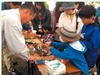
大工さんによる木工教室

家族連れでの参加も多く、午後からは森林インストラクターによるネイチャーゲームや木工教室などの体験イベントで盛り上がりました。