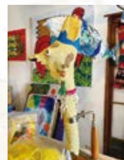
流木を彫刻刀で削ってペイントした『不思議イキモノ』