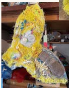
ゴム草履や洗濯ばさみが織り込まれたクジラのシッポ。漁業用のロープをほどいて、ほぐして使っている。