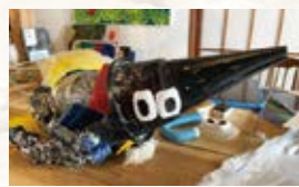
漁具で作った『カラス』