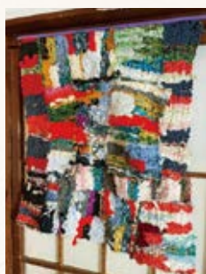
ORINASUの原点、裂き織のタペストリー。材料は不用になった洋服を裂いたもの。椅子の座面に使用し、リメイク家具を作っていたことも。