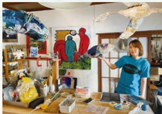
「いまの目標は個展を開くこと。今後は海だけでなく山にも活動の場を広げたい」と語るしばたさん。

「みなさんもぜひ機会を見つけて海岸清掃に参加してほしい」としばたさん。いつも海をきれいにしてくれている人たちへの感謝とリスペクトの気持ちを込めて、今日も工房で汗を流しています。