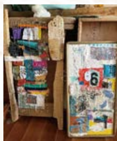
細かい漂着物はビニールなどの中に入れこみ、ボンドを使わず手縫いで作っているそう。