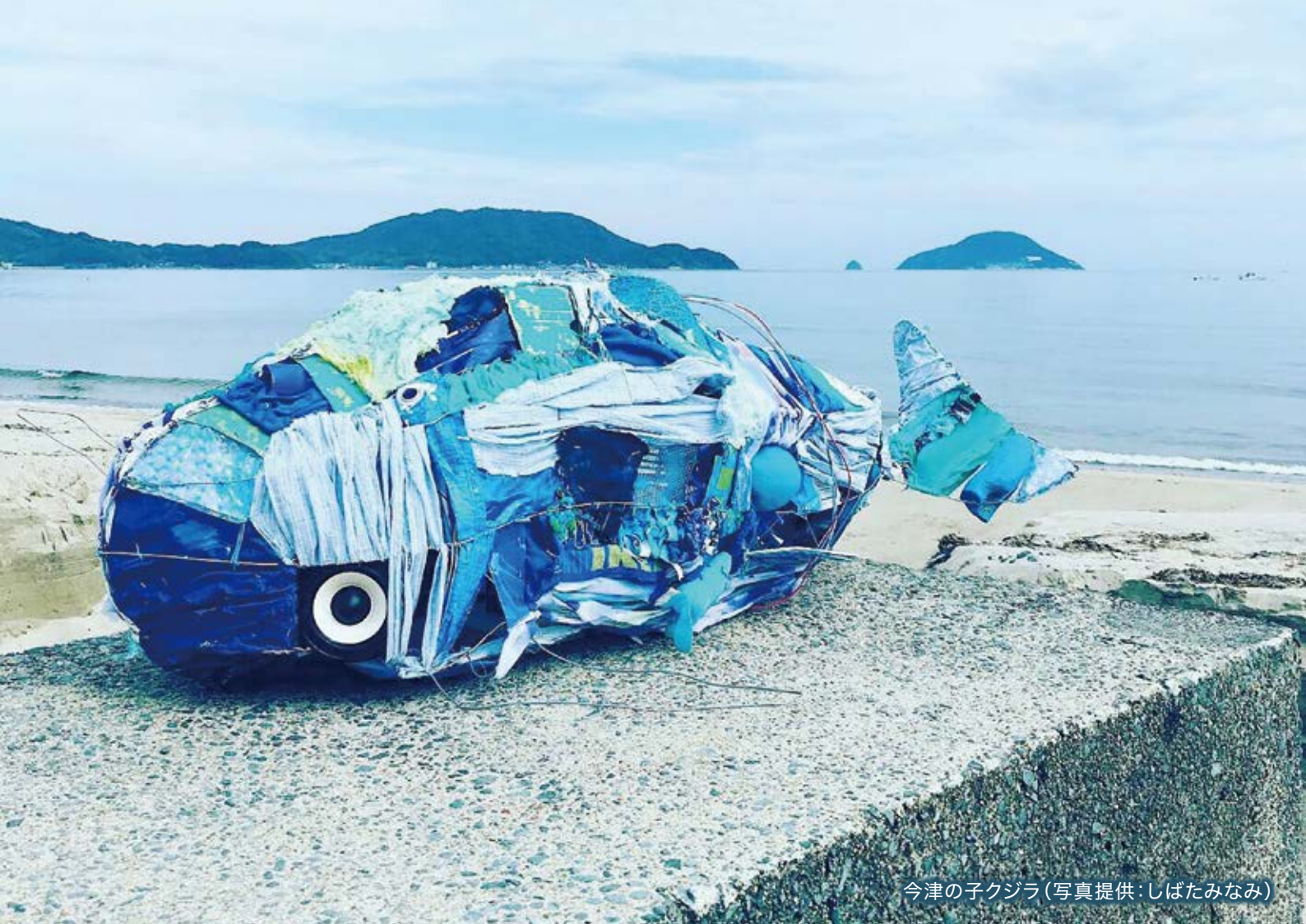
今津の子ジラ